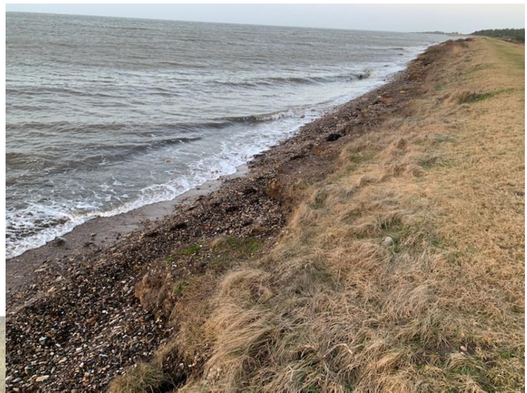
Diget i 2021 med borteroderet forstrand