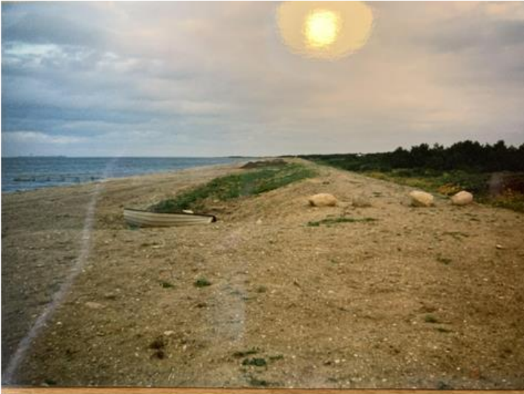
Det nye dige med forstrand i 1999

Nedenstående billeder skal minde os om, hvor vigtigt det er at passe godt på vort dejlige sommerhusområde.