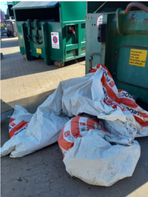
Figur 8 Tunge våde byggemåtter samlet op på stranden den 11. maj

Vi har ikke længere Palle til at klippe digekronen og tilkørselsstierne; men heldigvis har grundejere frivilligt og gratis klippet græsset på diget. Efter anden såning i foråret er græsset vokset fint op. Med en almindelig rotorplæneklipper kan kanterne også klippes ned så bredden på græsset er blevet større og sliddet i midten mindre. Et par bænke er blevet repareret og malet. Murerbaljerne blev fyldt med rustent jern og plastik, og de blev også afleveret på den store genbrugsplads i Hurup. I stedet for at smide hybenrosen højt op i container nr.17 vil de lave et hjørne af området til grønt haveaffald specielt til de invasive arter. Efter hver vinter kommer der nyt drivaffald på kysten, som skal indsamles og køres væk.