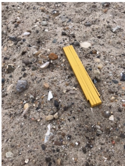
Figur 7: Tambohus-sandet som også blev vist i en spand på sidste generalforsamlingen.

Et andet berøringspunkt, hvor Thisted Kommune også er involveret, er deres krav i digeprojektet om kompenserende strandfodring med rent sand og ral, og det skal svare til en mængde der neutraliserer påvirkningen af nabostrækningen øst for anlægget . Den mængde afgravede digemateriale, som blev lagt på kysten ud for Edderfuglevej, svarede til 12 års strandfodringer. Thisted kommune svarede 12/7-2024, "at den kunne ikke anerkende flytningen af det afgravede materiale som imødekommelse af kravet i byggetilladelsen om kompenserende strandfodringer årligt med minimum 393kcbm rent sand og ral." Vi skulle have lagt de 4800kcbm ud langs egen digekyst!